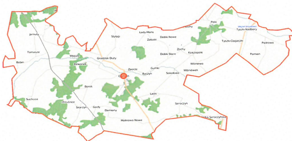
Rysunek 1. Mapa Gminy Czerwin.

Na terenie Gminy Czerwin znajduje się 45 sołectw.